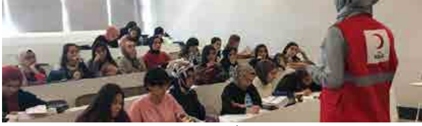
استمرار أعمال كسب المتطوعين

Türk Kızılay Bağcılar Toplum Merkezi sosyal uyum programı kapsamında، İstanbul Medipol Üniversitesi sosyal hizmet öğrencilerine yönelik Toplum Merkezi tanıtımı yaptı ve gönüllü başvurularını aldı.