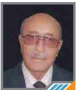
شاعر وكاتب سوري

ما عُدت أعزف لحن العشق والسمر وعفت سالفة الحوراء والحور فأمتي صفت في كف قادتها ولست ألف ذل العيش بالحفر ما شدني رجع أعمار ملفة لحايك سلم الأرزاق للحفر قد عاث في وطني كل اللصوص ضحى في ثوب مستعير أو خائن نكر وصار شر زناة الكون سادتنا فاستقرئ الحاضر المحفوف بالندر لا تسأل الأمس عن حال تدل به وأنت تطرد كالمسعود في المدر * وقادة العرب - لا عزت سمائهم - لا هون في سبق للهجن واحمر وضارب الطبل مثل الترد يقذفنا ولا يقدر إن كنا من البشر هذي حكايتنا فارقب نهايتها وطف بصاحبنا «المعتوه» بالنقر ما كنت أحسب في يوم توحدنا على المدلة في بدو وفي حصر * * * لكننا وجناب الله يجرسنا سندفن «الصل» في مستنقع قدر * ولن نكل وصوت الوعد يقرعنا «إن تنصروا الله ينصركم» على قدر * وسوف ترجع للمقموع هيبتة لتنستقيم الخطا من غير ما حذر * * * في نصرة الحق قد أخلصت ذائقي لكل حُر إذا ما قد دنا سفري لعل في بعض ما أملت من نعم يزيل أوزار ما أسرفت في عمري.