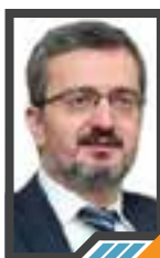
نموذج جديد في الدبلوماسية