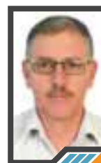
الثورة لم تبدأ يوم الحدث بل بدأت يوم القرار