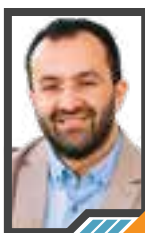
أثناء السير في القدس....