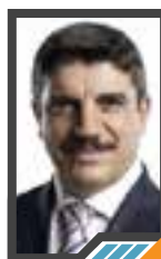
اللجوء في عالم جعلنا جميعاً غرباء