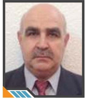
أكاديمي وباحث سوري